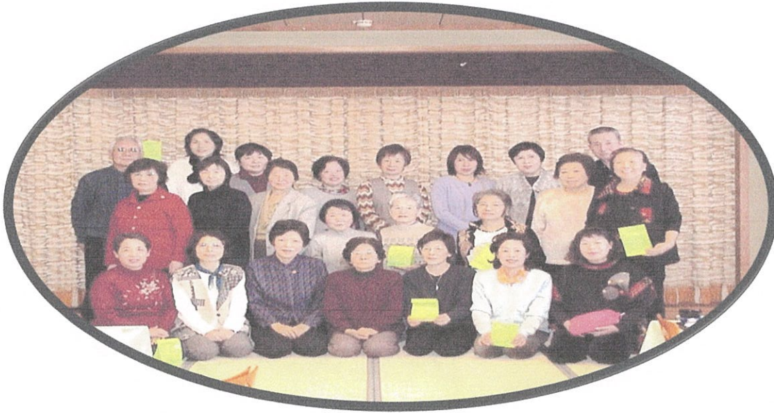
大山寺「なでしこの湯」大広間 平成 17 年 12 月 15 日