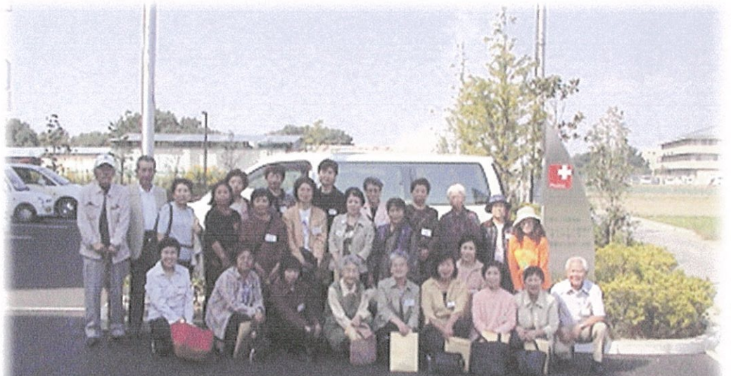
平成18年10月19日 施設見学 介護老人保健施設フェニックス西神戸ケアセンター