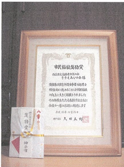
市民福祉奨励賞の賞状 平成 18 年 10 月 25 日