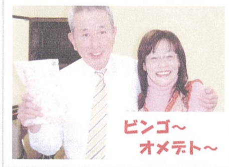
ビンゴゲーム 平成 21 年 12 月